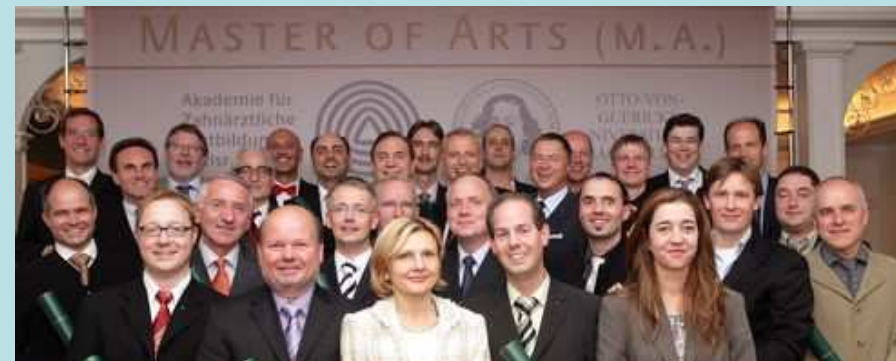
Abb.2: Erfolgreiche Masterstudenten der 1. Matrikel (2004-2006)

In episodischen und leitfadengestützten Interviews [3] äußerten 14 ehemalige Studenten (9 m, 5 w) der ersten drei Matrikel ihre Lernerfahrungen. Diese qualitativen Daten wurden einer Narrationsanalyse unterworfen. Erzählsegmente wurden bei den aussagekräftigsten Interviews (n=8) kodiert, die Codes in verschiedene Kategorien zusammengefasst und Kategoriennetze entwickelt, um die Lernerfahrungen nachvollziehbar darzustellen. Die Validität der Ergebnisse konnte mit einer Reevaluation durch die Studenten selbst überprüft werden.